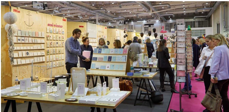
Das Nordlichter-Areal auf der Nordstil