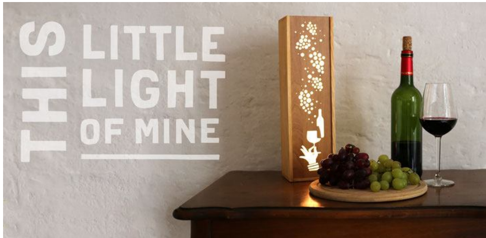
Holzleuchte Nina von LittleLight Design