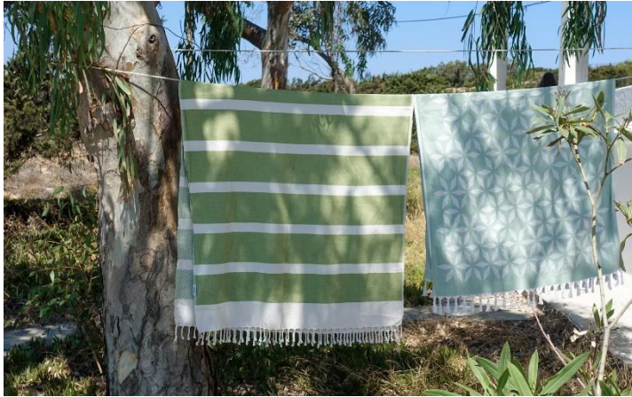
Die wunderschönen, handgemachten Hamamtücher und weitere fair hergestellte Lieblingsstücke finden Händler*innen am Stand B3.0 A14.

So beispielsweise Anette Pörtner von Wi-La-No (Abkürzung für "Wie lange noch?"), die mit einzigartigen Wandkalendern, fröhlichen ABC-Karten, raffinierten Messlatten für Kinder und vielen anderen intelligent gestalteten Produkten begeistert. Das unverwechselbare Layout bietet hohe Funktionalität in Kombination mit minimalistischem Design und liebevoller Farbauswahl. Die Kalender werden umweltfreundlich und regional in Braunschweig auf 100% Recyclingpapier gedruckt, verpackt und versendet.