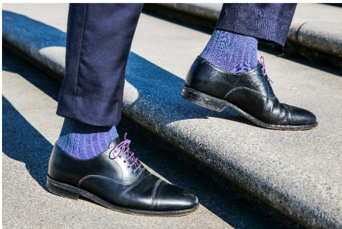
Bunt, bequem, bio: Die Socken von Faserwald am Stand B3.0 A18