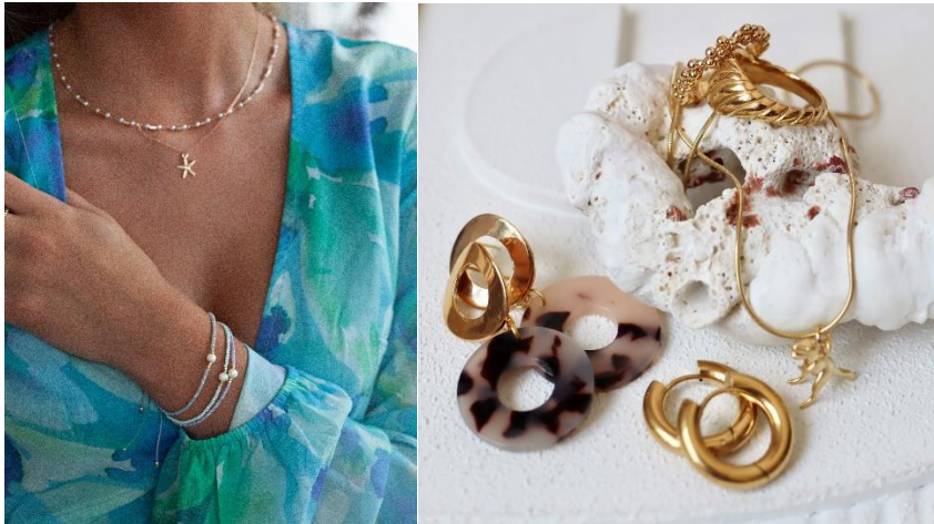
Echte Schmuckschätze gibt es bei timi of Sweden, am Stand B3.0 A12 (links) und bei Fräulein Wunder, B3.0 B15 (rechts).

Design, sondern auch mit echtem Purpose: Drei Prozent des Umsatzes jeder Bestellung gehen als Spende an die Stiftung Deutsche Depressionshilfe.