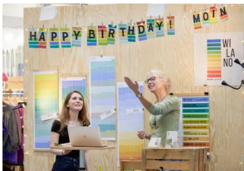
Happy Birthday, Nordstil: Die regionale Ordermesse feiert 2024 ihr zehnjähriges Jubiläum.

Zehn Jahre Nordstil! Zur ersten Jubiläumsausgabe im kommenden Jahr weht vom 13. bis 15. Januar 2024 eine frische Brise durch die Hamburger Messehallen. Denn die Winter-Nordstil hält spannende Highlights und Neuerungen für Aussteller und Besucher*innen bereit. Auf der Suche nach kreativen Designs, außergewöhnlichen Produkten und originellen (Zusatz-)Sortimenten wird das interessierte Messepublikum im A-Gelände fündig: Ob als Nordlicht oder als Mitglied im Village – in der Halle A3 präsentieren sich außergewöhnliche Manufakturen, innovative Start-ups und junge Talente. Auch im B-Gelände wird einiges geboten: Branchenexpert*innen laden zum Austausch und Wissenstransfer in das Nordstil Forum (Halle B1 EG) ein. Dort sind auch die Trendinseln zu finden, die mit kuratierten Ausstellerprodukten einen Ausblick auf die PoS-Trends für die kommende Saison geben. Direkt gegenüber locken die Buddelhelden mit originellen Spirituosen zum Probieren und Verweilen. Und das erfolgreiche Konzept des Anleger-Areals für alle Neuaussteller und Messerückkehrer geht in Halle B4 in die zweite Runde. Neue Marken und Rückkehrer warten nicht nur in den Sonderarealen der Nordstil. Diese Aussteller dürfen Besucher*innen nicht verpassen: