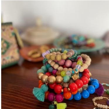
Außergewöhnliche Designs für jeden Geschmack finden Besucher*innen bei Samsara.

Die Marke umjubelt (Halle B7, E30) bietet hochwertige, handverarbeitete Lederaccessoires, die sich individuell gestalten lassen. Durch ein raffiniertes System können die Gürtel immer wieder neu kombiniert werden: Die verschiedenen Schließen können beliebig an die Gürtel dran geklickt oder wieder entfernt werden – und machen jedes Produkt zum Einzelstück. Die Gürtel werden in Handarbeit in Deutschland und Italien gefertigt; die Gürtelschnallen sind versilbert oder vergoldet und immer nickelfrei produziert. Alle Ledersorten sind rein pflanzlich gegerbt und gefärbt und sorgen für einzigartige Optik. Ein Produkt – viele Designs: Diesen Ansatz verfolgt auch das Label Oozoo Timepieces (Halle B7, G10): Ob Smartwatch, bunte Eyecatcher oder klassische Uhren im Vintage-Stil – die Uhrenmarke aus Heilbronn hält ein breites Produktangebot für die Besucher*innen bereit. Die abnehmbaren und austauschbaren Uhrenbänder erweitern die vielseitige Kollektion und sorgen für noch mehr individuelle Designs. Auch Armbänder, Ketten und Ohrringe sind Teil des facettenreichen Sortiments.