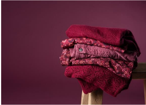
Das Label Heidekönigin bietet farbenfrohe, langlebige, nachhaltige Designs. Gute Laune garantiert!

Die Marke umjubelt (Halle B7, E30) bietet hochwertige, handverarbeitete Lederaccessoires, die sich individuell gestalten lassen. Durch ein raffiniertes System können die Gürtel immer wieder neu kombiniert werden: Die verschiedenen Schließen können beliebig an die Gürtel dran geklickt oder wieder entfernt werden – und machen jedes Produkt zum Einzelstück. Die Gürtel werden in Handarbeit in Deutschland und Italien gefertigt; die Gürtelschnallen sind versilbert oder vergoldet und immer nickelfrei produziert. Alle Ledersorten sind rein pflanzlich gegerbt und gefärbt und sorgen für einzigartige Optik. Ein Produkt – viele Designs: Diesen Ansatz verfolgt auch das Label Oozoo Timepieces (Halle B7, G10): Ob Smartwatch, bunte Eyecatcher oder klassische Uhren im Vintage-Stil – die Uhrenmarke aus Heilbronn hält ein breites Produktangebot für die Besucher*innen bereit. Die abnehmbaren und austauschbaren Uhrenbänder erweitern die vielseitige Kollektion und sorgen für noch mehr individuelle Designs. Auch Armbänder, Ketten und Ohrringe sind Teil des facettenreichen Sortiments.