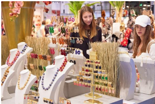
Der Bereich Schmuck & Mode auf der Nordstil bietet eine einzigartige Produktvielfalt.