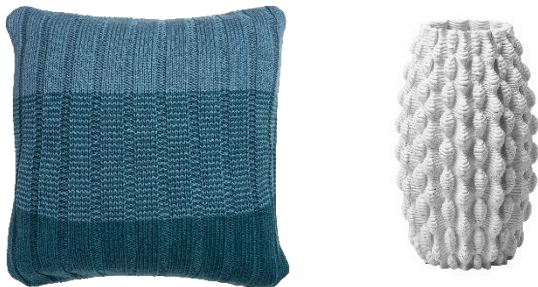
Sorgen für Mee(h)r Momente: Das Kissen in Blockstreifen von Tranquillo und die Vase aus 3D-Print von Chic mic.

Inspiziert vom Meer, lädt dieser Designtrend zum Träumen ein: Blau in vielfältigen Varianten, von Azur und Königsblau über Türkis und Indigo bis hin zu Petrol und Schwarzblau dominiert die Farbskala und assoziiert Weite und Sehnsucht. „Mee(hr) Momente“ beflügeln die Fantasie, laden zu kleinen Fluchten im Alltag ein und versprühen die Leichtigkeit einer frischen Brise. Die Formen- und Motivsprache ist an den marinen Lebensraum angelehnt; Beige und Weiß, beispielsweise in Streifendesigns, sorgen für ein harmonisches Flair. Farbliche Akzente in angesagtem Orange überraschen mit einem zeitgemäßen Twist. Kühles Porzellan und Glas, aber auch Objekte aus Holz und Flechtwerk erinnern an die maritime Lebensart. Das Thema spielt mit der Me(e)hrlagigkeit der Materialien, der Transparenz von Textilien und anderen Werkstoffen. Auch in ihrer Feinheit oder ihrer groben Textur zeigt sich die assoziative Nähe zum Meer.