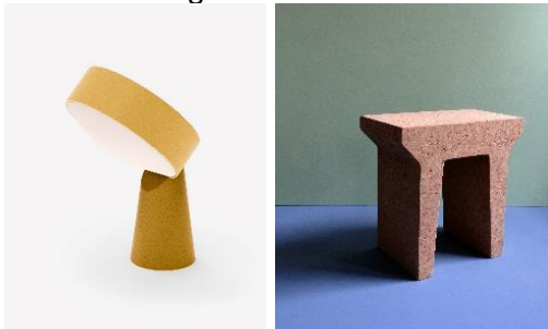
Die goldene Lampe von recozy und der Hocker von The Home Project Design Studio präsentieren das erste Trendthema „Mix & Match“.

Das kommende Jahr feiert kreative Ausgelassenheit jenseits von Normen, dafür aber mit expressiven Gestaltungselementen in kräftigen Farben wie Rot in all seinen Facetten, Blau, Gelb und auch plakativem Grün, aber auch „Un-Farben“ wie Schwarz, Braun und Weiß. Überraschende Fuchsia-Akzente sorgen für einen Wow-Effekt, wirken pulsierend und vermitteln Lebensfreude. Gegensätze vereinen sich harmonisch zu etwas Neuem: Energiegeladene geometrische Muster treffen auf verspielte organische Elemente; Future Retro integriert eine Formensprache, die von der Natur inspiriert ist – jeder Mustermix ist in der kommenden Saison willkommen. Der Fantasie sind keine Grenzen gesetzt und Maximalismus ist das Schlüsselwort: Sinnlich und kraftvoll präsentiert sich Design im Jahr 2024. Grobe Texturen mit ausgeprägter Struktur und Haptik wie Leder, Cord, Fell, Kork und Glas sorgen für eine neue sinnliche Qualität.