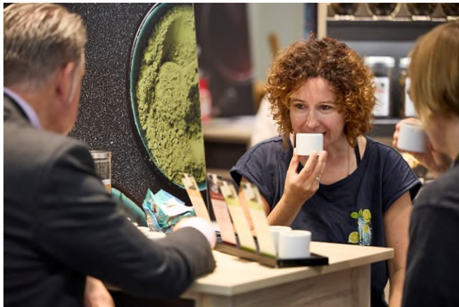
Riechen, schmecken, genießen: Die Genussmeile führte die Nordstil-Besucher zahlreich in die Hallen B1 und B2. OG.