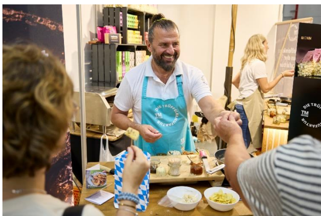
Probieren, entdecken, begeistern lassen: Genuss live auf der Nordstil Winter 2026.